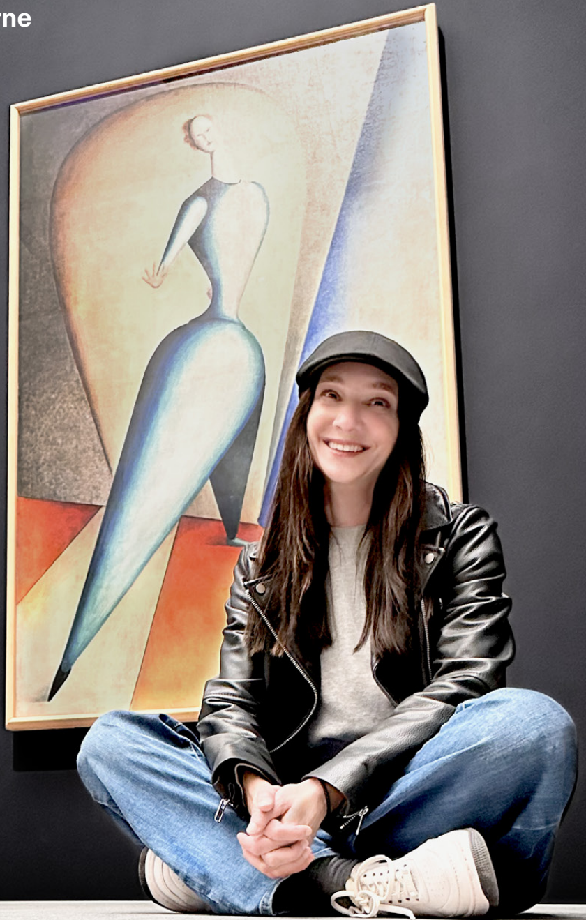
Oskar Schlemmer „Tänzerin (Die Geste)“, 1922/23 Öl und Tempera auf Leinwand

True Play Is Experiment. In der Pinakothek der Moderne