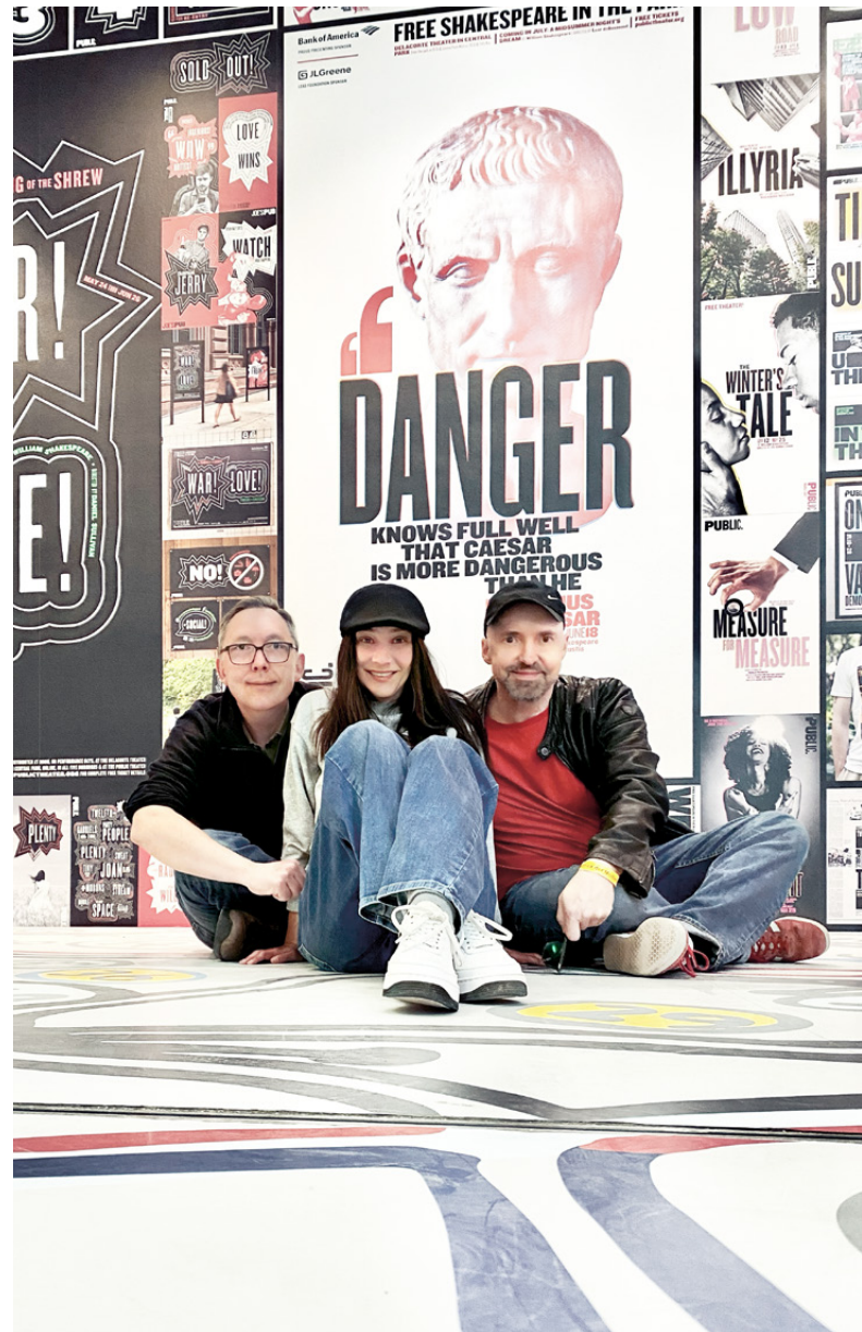
„Paula Scher: Type is Image“, Raumbezogene Installation Die neue Sammlung, Pinakothek der Moderne

In unserem Fluxus Event waren meine Designerkollegen und ich Publikum und Künstler zugleich, das Museum Angebot und Bühne. Wir haben die Kunst genutzt, um uns inmitten von dieser in Szene zu setzen. Wir haben uns gleichzeitig auf die Kunst eingelassen, auf die Techniken der Künstler und deren Antrieb.